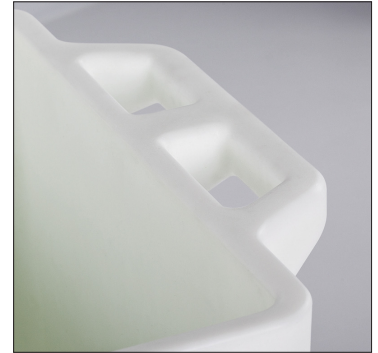
Poignées de conception ergonomique.