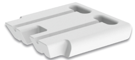
Poignée de chariot disponible en option