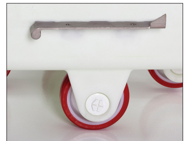
Supports en acier inoxydable intégrés.