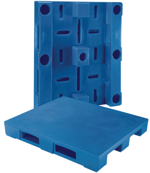
DP40F (surface plate)