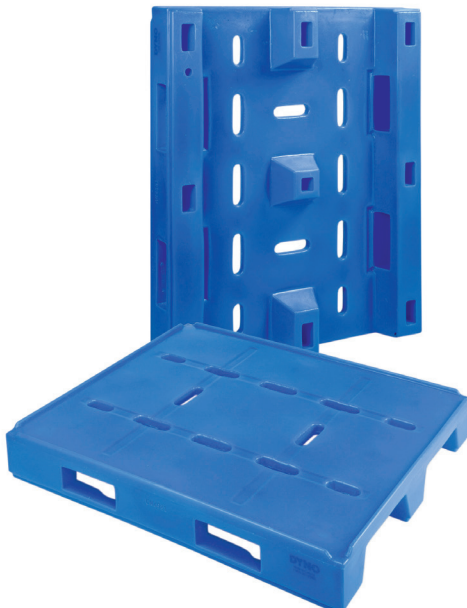
DP40R (avec rebords)